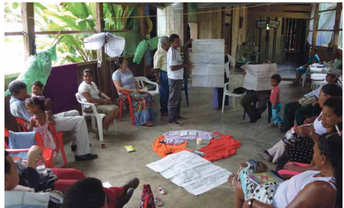
* Aan de slag tijdens een bijbelstudie in het project Geloven in Verzoening.

Auteur is beleidsmedewerker bij Kerk in Actie.