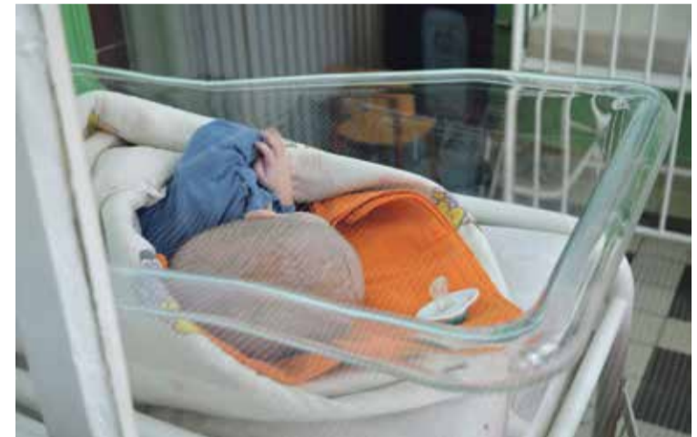
* Een van de kinderen in het ziekenhuis in Beregowo.

Auteur is stafmedewerker bij Children's Relief.