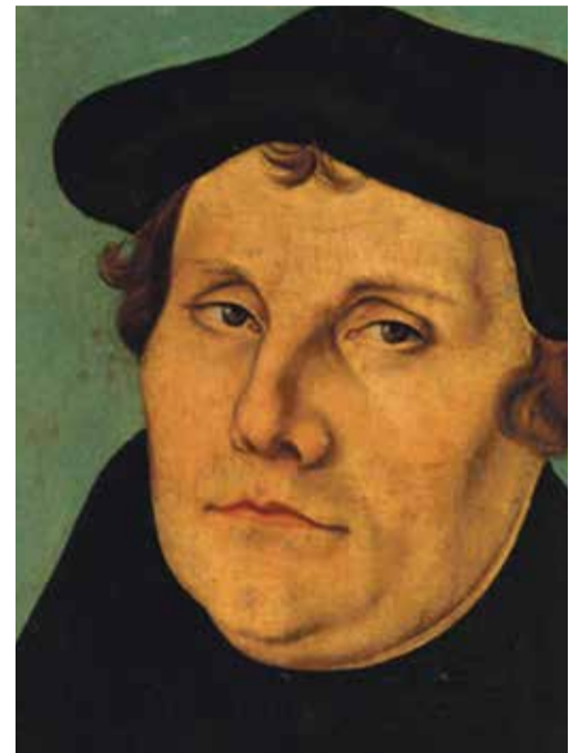
* Luther: "...Ware vrijheid is alleen te vinden in de verbinding met Jezus Christus"...

Zie verder pagina 8: De niet serieus genomen kritiek van Luther