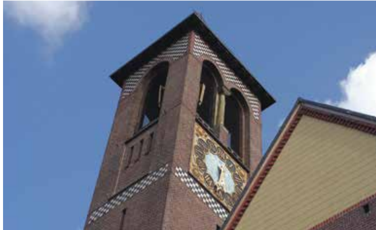
* H. Antonius van Padua – toren.

In het interbellum was het de (katholiek geworden) architect Kropholler die een kerktype introduceerde, dat overall in Nederland navolging vond. Het waren echte 'volkskerken' met een breed middenschip, de in het zicht gelaten en gevels in traditionele baksteenarchitectuur.