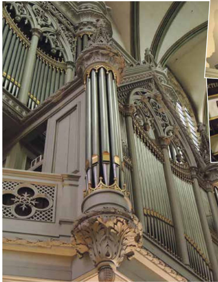
* Het door Bätz gebouwde orgel in de Domkerk.