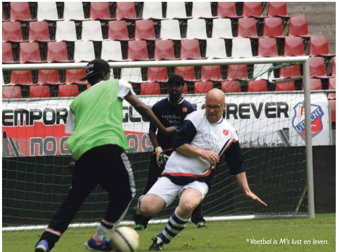
*Voetbal is M's lust en leven.

Ik zou nieuwe afspraken willen voorstellen voor vluchtelingen in Nederland die over het hoofd worden gezien. Mensen zoals ik die tussen wal en schip vallen. De nieuwkomers zijn wel in beeld, maar de ‘oudkomers’ zoals ik worden door de politiek niet meer gezien. Gelukkig heb ik wel een asieladvocaat die me advies geeft.