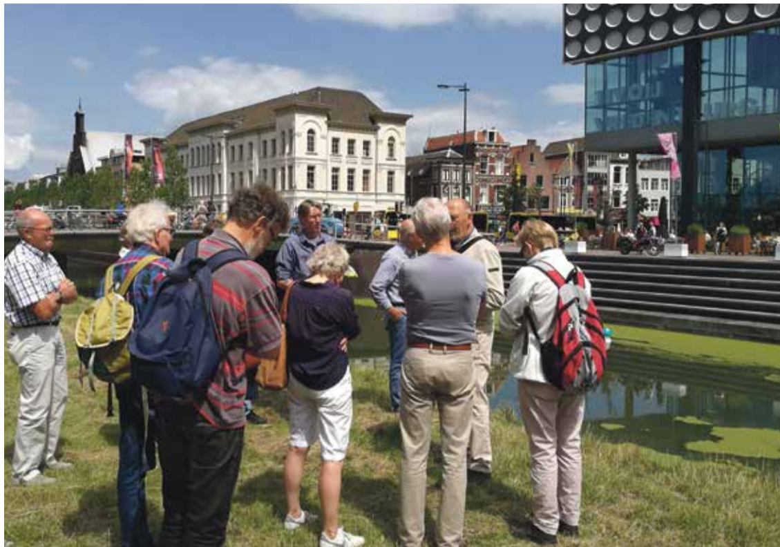
* Stilstaan tijdens de themawandeling op de plek waar eeuwen eerder hagepreken werden gehouden.

matie. De wandeling voert ons ook langs het huis van de zeer begaafde dichteres, theoloog en kunstenaar Anna Maria van Schurman (1607-1678), die door