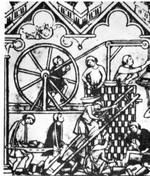
* Bouw van een godshuis in de oudheid (links) en in de middeleeuwen. Illustraties uit het boek 'De bouw van een kathedraal' van Jean Gimpel, uitgave Pictura Utrecht 1960.