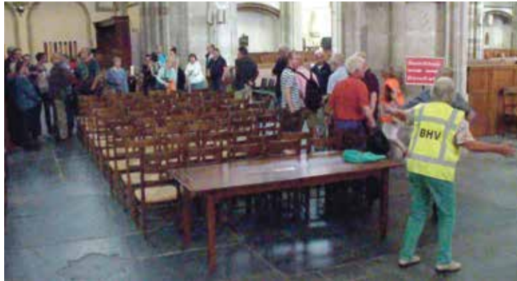
* ..."Opschieten, er uit!"... Beeld van de ontruimingsoefening in de Domkerk.

De oproep om figurant te zijn in een ontruimingsoefening in de Domkerk wekte mijn interesse. Zelf was ik net bezig met het volgen van een basiscur-sus bedrijfshulpverlening (BHV). Zo'n oefening leek mij een uitstekende kans om mijn vers gewonnen kennis te versterken. Grijpen die kans dus.