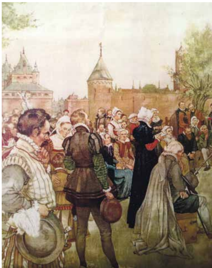
* Hagepreek tegenover Vredenburg (tekening van H.J. Isings uit 1911).

De groep stelt zich op bij de Catharijnebaan en kijkt praktisch uit het muziekcentrum. Gerrit begint zijn tocht hier, omdat hier een van de eerste hagepreken gehouden werd in augustus 1566, in het zicht van kasteel