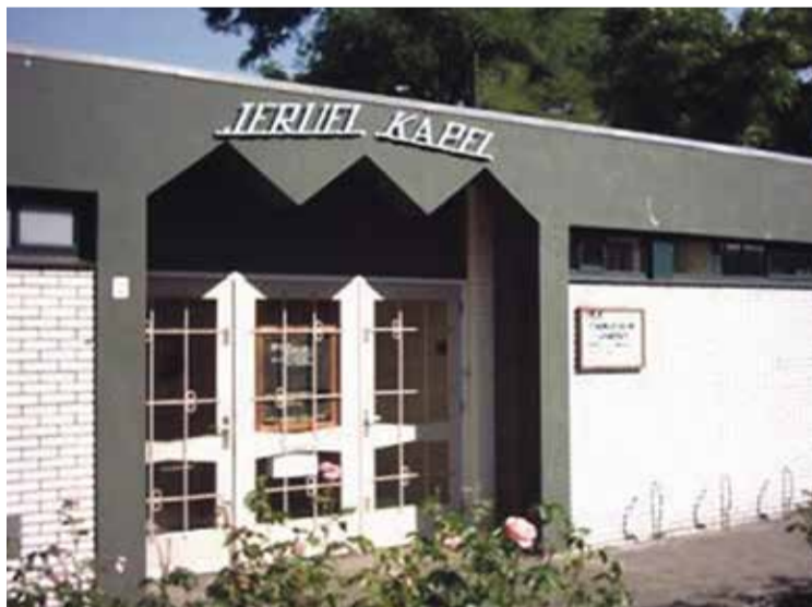
* De Jeruëlkapel aan de Invoordreef. Het gebouw uit de eind zestiger jaren blijft een kerkelijke bestemming houden, want het is verkocht aan de evangelische broedergemeente Utrecht en omstreken, beter bekend als de Hernhutters.

minimaal aantal activiteiten bij om geloofwaardig in de samenleving te staan. Het lukt ons niet meer om daaraan te voldoen.”