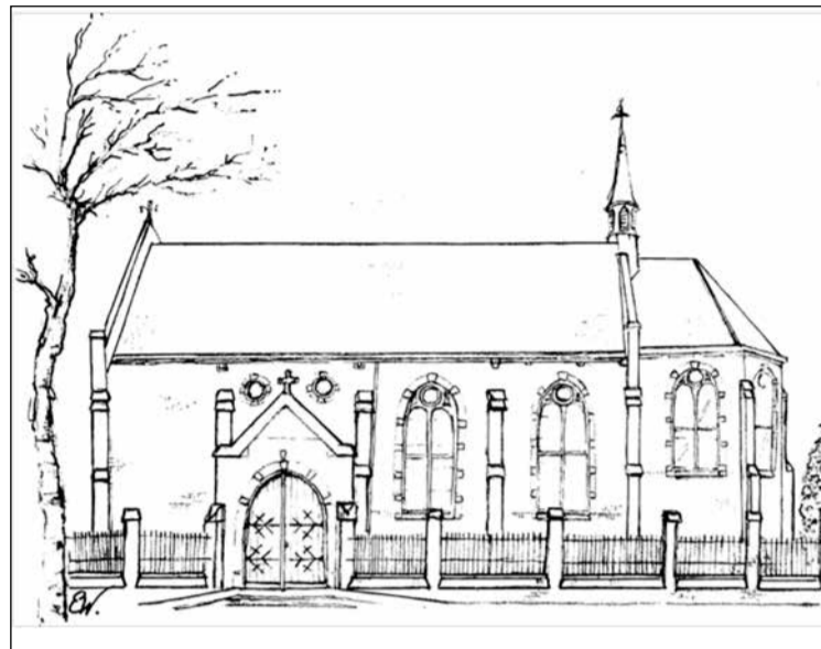
* Holy Trinity Church (tekening Emily Wilkinson).

Wat zijn de eigenschappen van de Psalmen in de nacht, boven alle andere liederen? In de eerste plaats kunt u er zeker van zijn, dat wanneer u iemand een Psalm hoort zingen in de nacht – ik bedoel in de nacht van zorgen – dat het een Psalm is uit het hart. Kunt u zingen in pijn en vervolging? Dat laat zien dat uw hart in dat lied is. We kunnen natuurlijk gemakkelijker zingen als iedereen zingt. Het is de stilte van de nacht, die haar lied zo zoet maakt. En zo wordt de lofzang oprecht, omdat het