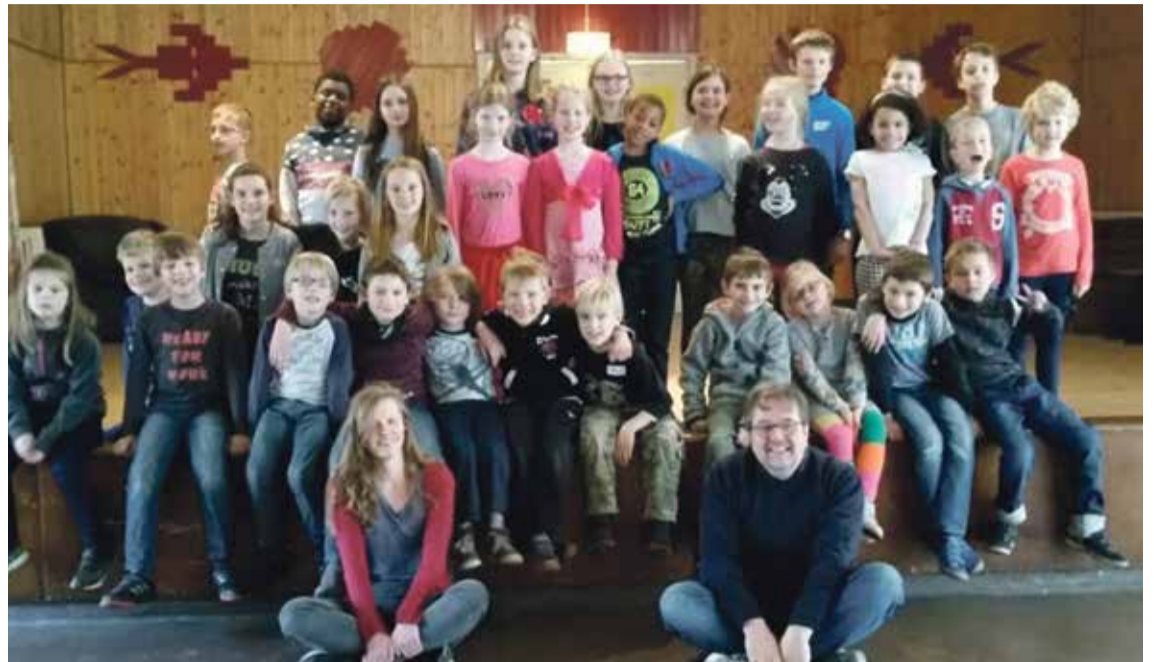
* De crew van Musical Mozes.