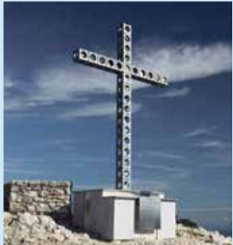
* Het Europakruis..

Op dinsdag 9 mei presenteren de 'Drie Utrechtse Kathedraalen' een symposium over de toekomst van Europa. Met dit symposium willen de rooms-katholieke Sint Catharinekathedraal, de oud-katholieke Sint Gertrudis kathedraal en de protestantse Domkerk een bijdrage leveren aan het publieke debat over de toekomst