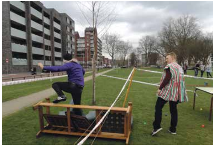
*'Op expeditie' was een ludiek onderdeel van het feestprogramma bij de viering van drie jaar Villa Vrede (foto Wilma Rozenga).

activiteit moesten er vijf opdrachten gedaan worden. Deze opdrachten bestonden uit het lopen van een hindernisbaan, een cultureel fotospel, met spuitverf een gezamenlijk doek opfleuren, het roosteren van brood op vuur en een oriëntatieopdracht (het