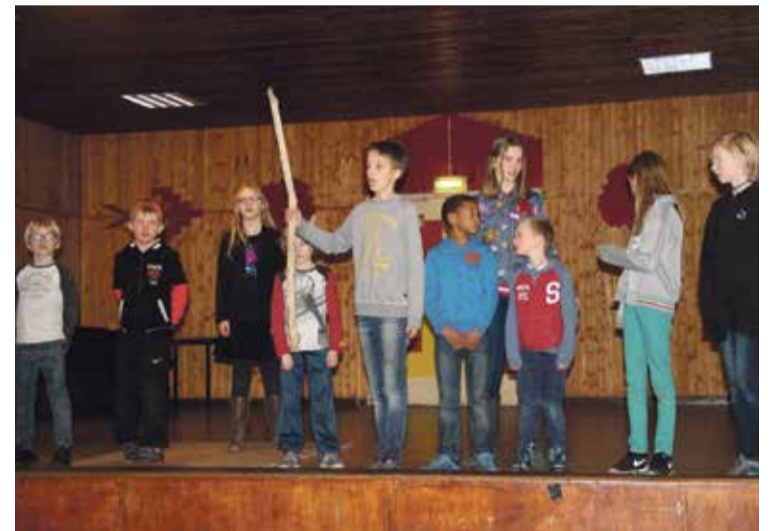
*Veel oefenen voor de musical Mozes.