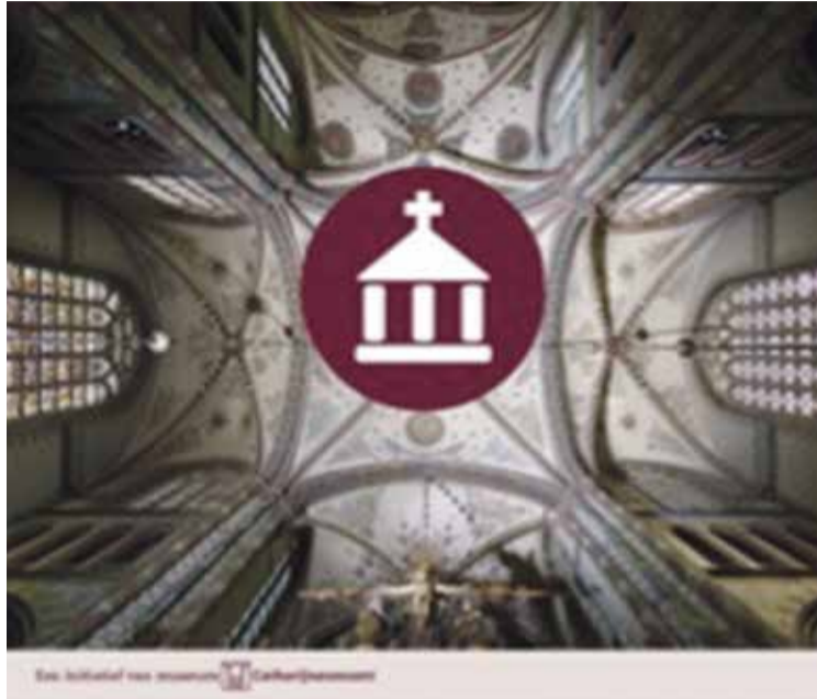
* Logo van het project Het Grootste Museum van Nederland.

Met de start van het Grootste Museum van Nederland komt er een gemeenschappelijke website waarop alle deelnemende locaties zich presenteren met hun openingstijden en beschikbare faciliteiten. Zo moet de bezoeker het