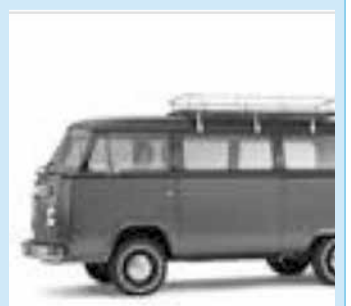
* De uitvaartbus van Alting.

In de middaguren van zaterdag 6 mei is er in de Geertekerk een informatiemarkt van 13.00 tot 15.30 uur. Dit alles in het kader van het tienjarig jubileum van Alting Uitvaarten. Op de uitvaartinformatiemarkt zijn eigentijdse producten en diensten, zoals een kist van bioplastiek, de composteerbare urn en de herinnerdoos. Op het plein kan men een kijkje nemen in de uitvaartbus en de uitvaartvolkswagenbus. Met meer dan 25 exposanten en muzikale intermezzo's biedt deze middag gelegenheid om op allerlei manieren met de dood bezig te zijn.