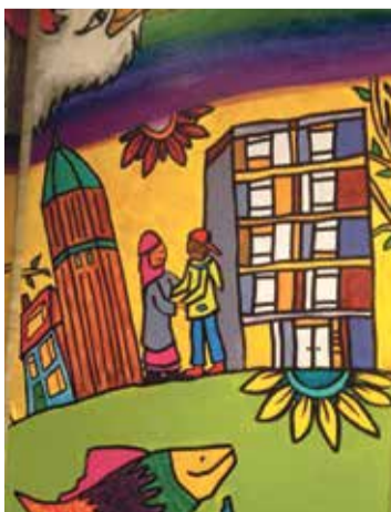
* Detail van een paneel in het Johannescentrum.

Mensen die al jaren in Overvecht wonen en die het liefst weg zouden willen, omdat ze zich niet meer thuis voelen. Mensen die er al jaren wonen en nergens anders zouden willen