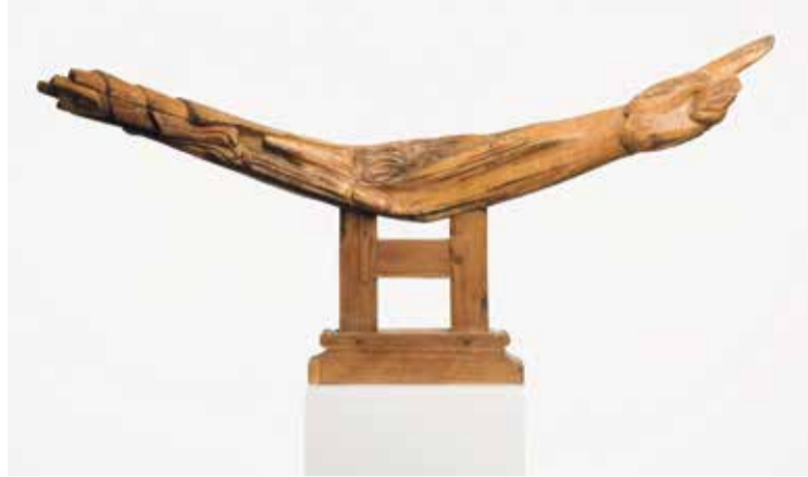
* 'Wie draagt mij?' – Werk van Tom Waterreus.

De beelden die in de Tuindorpkerk zijn tentoongesteld nodigen uit tot een bedachtzaam kijken, een soort proeven, zoals men dat ook kan doen bij poëzie of religieuze teksten. In feiten zijn al zijn beelden poëtisch van aard, met een bijzondere vormtaal, gebruik makend van nieuwe metaforen voor oude verhalen en met een eigen ritmiek.