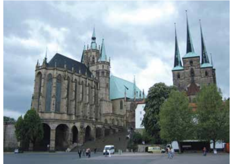
* 'Heldenstad' Leipzig, is een voornaam doel van de Lutherreis.

Het slotstuk van dit Lutherjaar is de inspiratiereis die we van 17 tot en met 23 september willen gaan maken naar het land van Luther. We beginnen onze reis in Eisleben, de plaats waar Luther in 1483 werd geboren en waar hij in 1546 overleed. Vervolgens gaan we naar Eisenach, als jongeman ging Luther hier naar de katholieke school (van 1498 tot 1500; hij verbleef hier bij verwanten). Het Lutherhaus bestaat nog steeds. In 1523 verbleef hij in de nabijgelegen Wartburg (onder een valse naam), waar hij in elf weken de