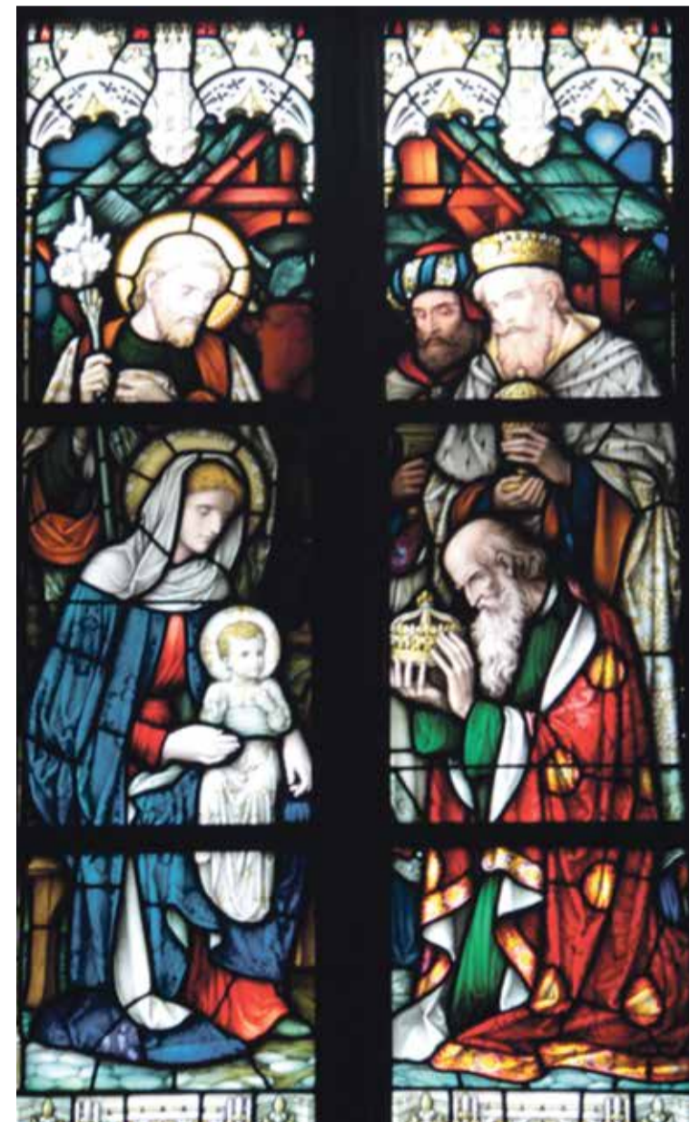
* Aanbidding van de Wijzen, koor van Holy Trinity Church

Tot zover een korte impressie van een preek van C.H. Spurgeon. Hij inspireert ons om psalmen te zingen, in het bijzonder in de nacht. Spurgeon was een baptistenpre-