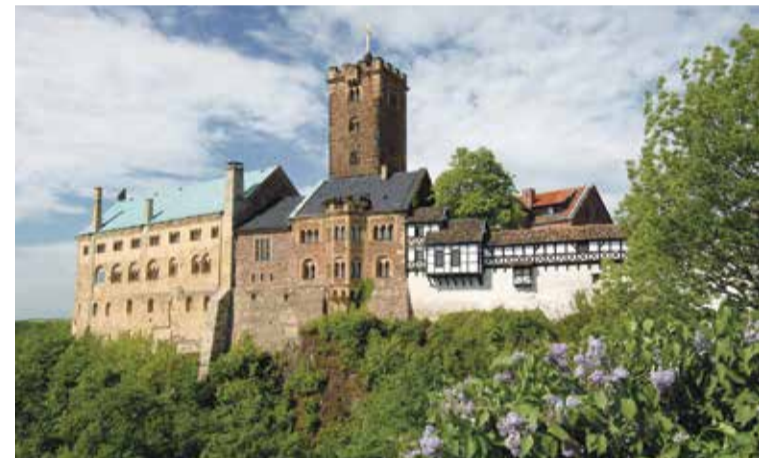
* In Wartburg vertaalde Luther binnen drie maanden de Bijbel in het Duits (foto's Dick van Dijk).

Bijbel in het Duits vertaalde. Later keerde hij naar Eisenach terug om de Reformatie te leiden.