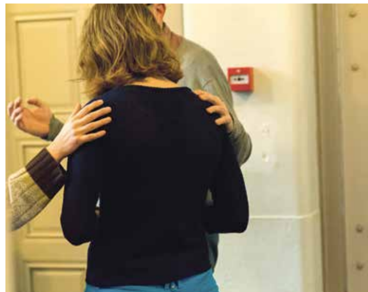
* Samen bidden tijdens de Ministry opdraagdienst.

"Het begint al echt een plek te vinden in de kerkdienst. Tijdens de dienst heb je natuurlijk alle ruimte om stil te zijn en soms word je door iets geraakt waarover je wilt doorbidden. Na de