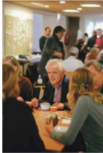
* Uitwisseling: altijd leerzaam!