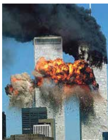
* 9/11 (2001) – uiting van Arabische haat jegens 'het westen', Twin Towers.

Met onmiddellijke ingang werden op 8 november 1938 alle Joodse kranten en tijdschriften verboden. Op dezelfde dag werd ook afgekondigd dat Joodse kinderen niet meer werden toegelaten tot Duitse (Arische) scholen en dat alle Joodse culturele activiteiten voor onbepaalde tijd werden opgeschort.