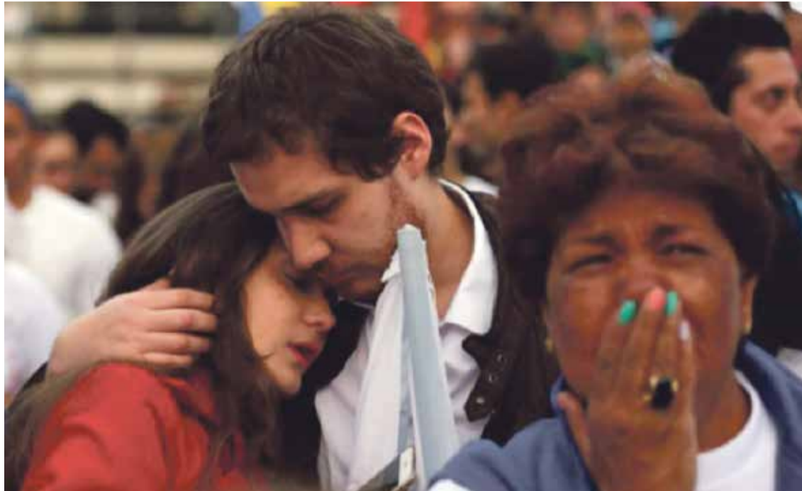
* Ontzetting in Colombia na het bekend worden van de uitslag van het referendum.

In de regio's die het meest geraakt zijn door de strijd met de FARC heeft het ja ruim gewonnen. Een duidelijke boodschap. De directe slachtoffers willen vrede en ondersteunen de akkoorden met de FARC. Maar 'de wrok van de stedelingen wint het van de verging van de boeren' klinkt het al