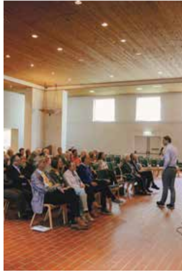
* De Utrechtse ambtsdragers bijeen.