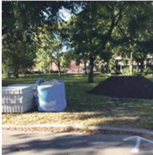
* Labyrint in Overvecht – the making of.