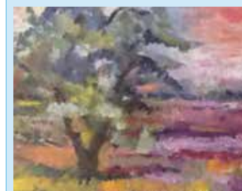
* Landschap (detail), geschilderd door Fredy Schild.