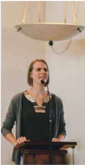
* Presentatie over Night of Lights.