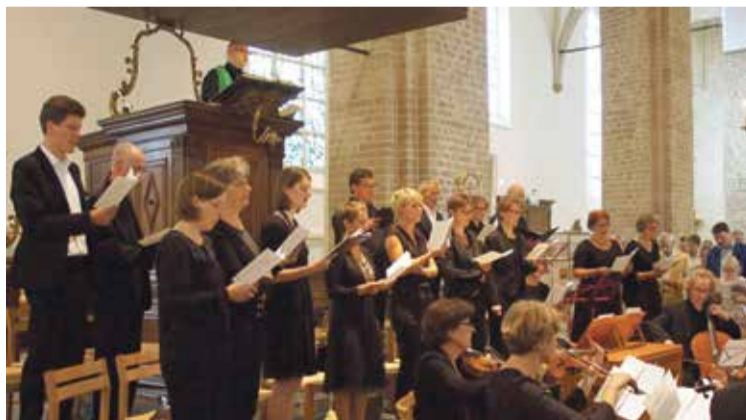
* Vespercantorij en Cappella di San Nicolai.

De Eerste Advent, het begin van het nieuwe kerkelijk jaar, is het begin van een periode van verwachten, van stil staan bij het komen van Jezus in de wereld, ook in