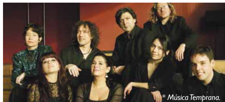
* Música Temprana.