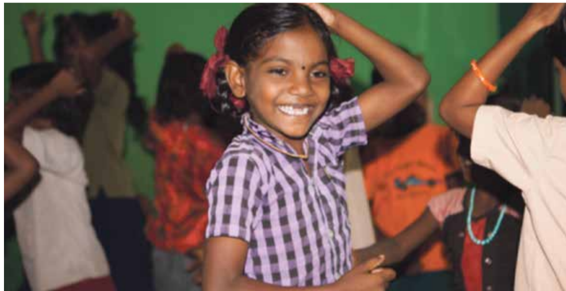
* Dansles op een van de scholen van SAVE, de door Nieuwe Kerk en Tuindorpkerk gesteunde stichting die in India strijdt tegen kinderarbeid.

De bijeenkomst heeft de vorm van een viering. Een gebed. Een lied, op piano begeleid door de financiële man van Kerk in Actie. Ontmoeting, delen van verhalen, ervaringen. Ervaringen van een gemeente, die jongeren op bezoek kreeg van het project op Sumatra dat zij steu-