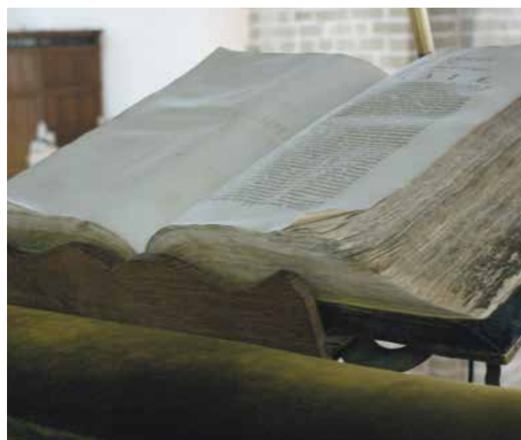
* Kanselbijbel in de Nicolaïkerk.

De Prentenbijbel voor jonge kinderen (4 tot 7 jaar) bevat verhalen uit het Oude- en het Nieuwe Testament.