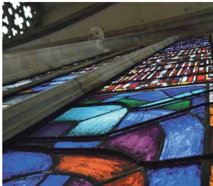
* Ramen in de gotische kathedraal zijn een bezienswaardigheid op zich.

Allereerst zijn daar de prachtige deuren van Theo van de Vathorst. Alle voorstellingen in deze deurpartij hebben betrekking op de werken van barmhartigheid en in het bijzonder op deze verzen van de evangelist Matteüs, waarin de werken zijn uiteengezet. In afwijking van de traditie, die zeven werken van barmhartigheid kent, noemt Matteüs, er slechts zes: hongerigen te eten en dorstigen te drinken geven, vreemdelingen huisvesten, naakten kleden, zieken en gevangenen bezoeken. Het begraven van de doden hoort er