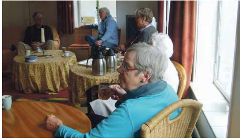
* Huiskamer, interieur (foto Marian van Giezen).

Buurtbewoners zijn welkom voor een praatje bij een kopje koffie of thee, een spelletje of gewoon even rustig een tijdschrift lezen op de bank. Er worden nieuwtjes uitgewisseld en er is belangstelling voor hoe het met je gaat. Sinds de start van deze inloop, ongeveer vier jaar