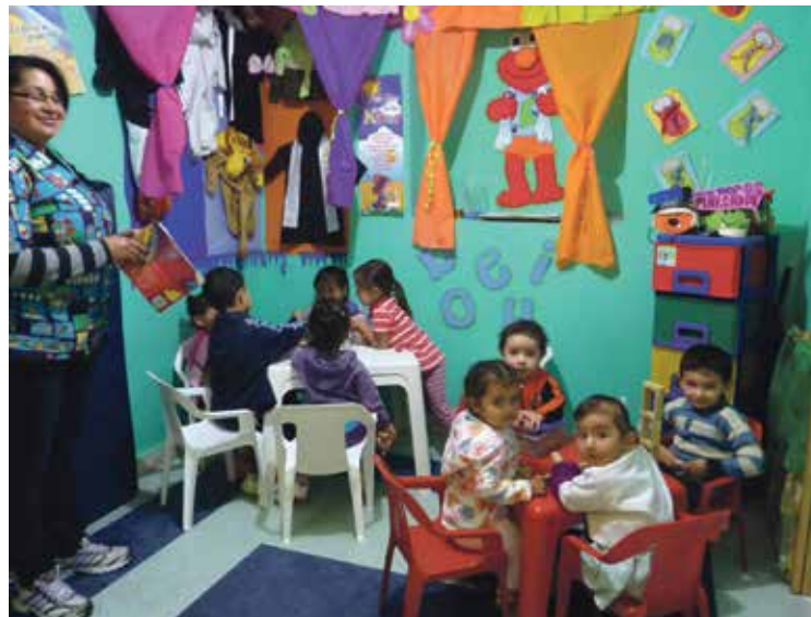
* Een crèche van Mencoldes.