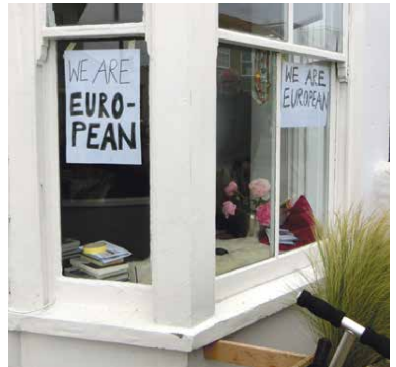
* Lopend in St Ives kwamen we dit raam tegen.

Veel boerderijen runnen een winkel met groente van eigen land, hebben een Bread & Breakfast, vakantiewoningen, een kleine camping of schenken echte Cornish Cream Tea. Toerisme is nu eenmaal de belangrijkste bron van inkomsten. Met alle nadelen van dien, dorpen waarvan 's winters de helft van de huizen onbewoond is, waar de school is verdwenen en winkels toegesneden zijn op het toerisme. Kleine vis-