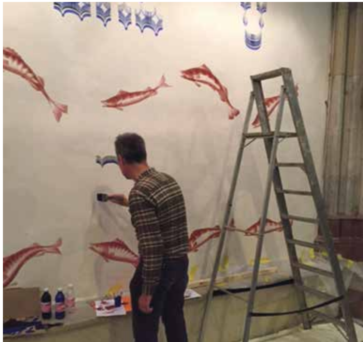
* De wandschildering ontstaat....

Het thema van het kunstwerk sluit aan op het sacrament van de doop. Dichtbij bevindt zich namelijk de grote stenen doopvont, die middenin de entree ruimte staat opgesteld. De daarop aangebrachte voorstellingen verwijzen naar de betekenis van de doop; het begin van een nieuw leven. Het volk van Israël trekt vanuit de woestijn door de (grens) rivier de Jordaan het Beloofde Land binnen en Johannes de Doper dient Christus het doopsel toe met water uit de Jordaan, terwijl boven hen de Heilige Geest verschijnt in de vorm van een duif. Het blauw van water vormt daarom de andere hoofd tint. De vis, die een zo uitgesproken christelijke symboliek heeft, is in allerlei versies in de voorstelling opgenomen.