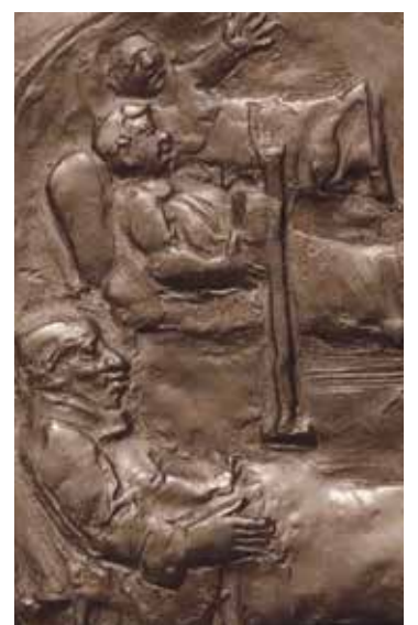
* Detail uit de deur van de Domkerk: bezoek aan de zieken.