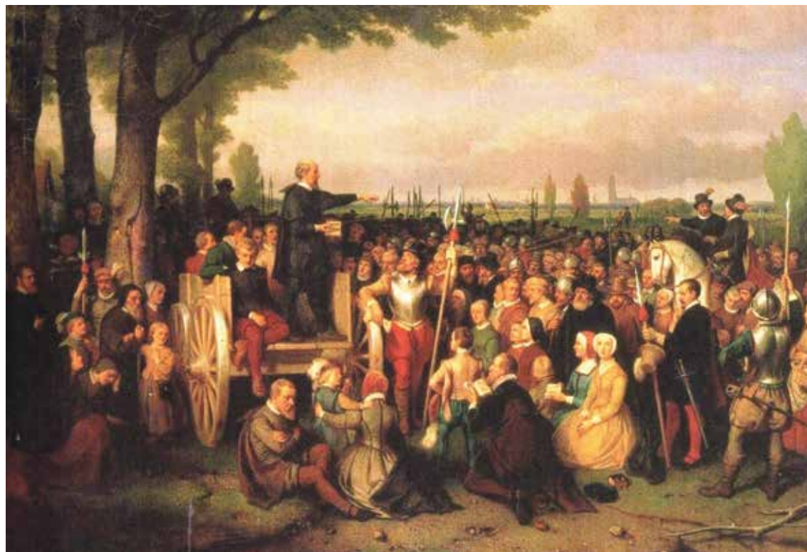
* Hagenpreek buiten Utrecht. Schilderij van S. de Poorter, 1850 (Rijksmuseum, Het Catharijne Convent, Utrecht).

tendpreek kwam een aantal voormannen van de hervormingsgezinden naar het stadhuis en vroeg het stadsraad twee kerken beschikbaar te stellen voor hun religieuze bijeenkomsten. Het stadsbestuur, beducht voor opstand, stelde de beslissing hierover uit tot de volgende dag, maar liet op voorhand alvast beelden en altaarstukken uit de Geertekerk weghalen. Enkele protestanten die dit zagen, wilden de kerk in om te zien of alles was weggehaald en begonnen onmiddellijk de nog resterende beelden en kruizen stuk te slaan. Daar bleef het bij. Een dag later, op zondagochtend 25 augustus, krijgt het stadsbe-