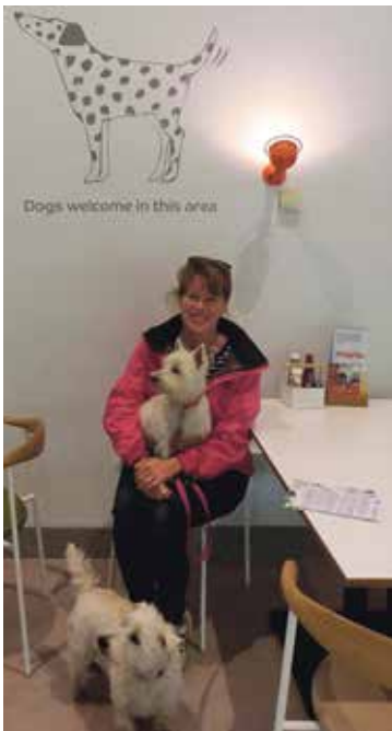
* In het café van Trebah Garden bij Falmouth zijn honden heel welkom.

heel anders dan een stiltemeditatie in een Utrechtse kerk, afgezien van het geluid van klotsende golven en krijsende meeuwen. Om acht uur zeggen we gezamenlijk de zegenbede: "De genade van onze Heer Jezus Christus, de liefde van God en de gemeenschap met de Heilige Geest zij met ons allen, altijd weer". Ook de gespreksgroep eindigt hiermee: "Let us say the grace".