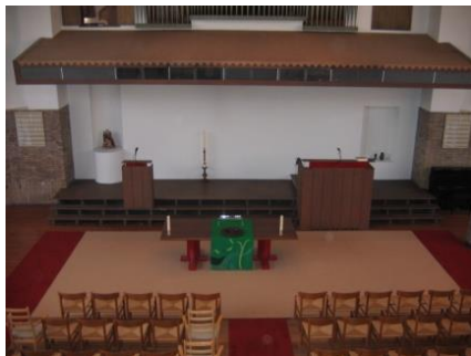
Grote ruimte voor in de zaal