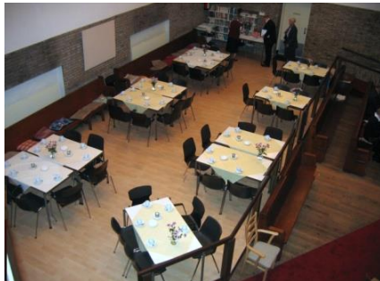
Royale koffiehoek links

Ringleiding voor gehoorgehandicapten. Projectiemogelijkheid met aanwezige beamer. Geluidsinstallatie met afspeel- en opname apparatuur.