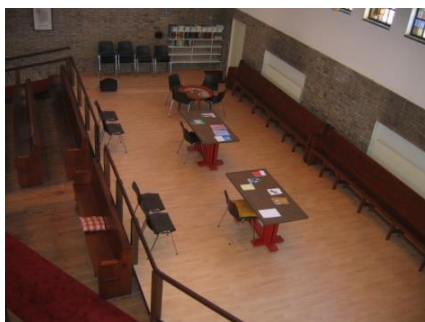
Aparte ruimte in de zaal rechts