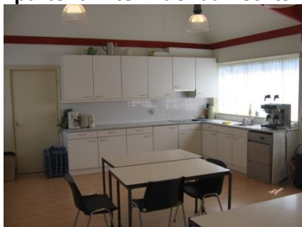
Martenskamer annex keuken