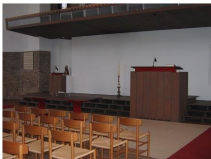
Groot en Klein spreekgestoelte