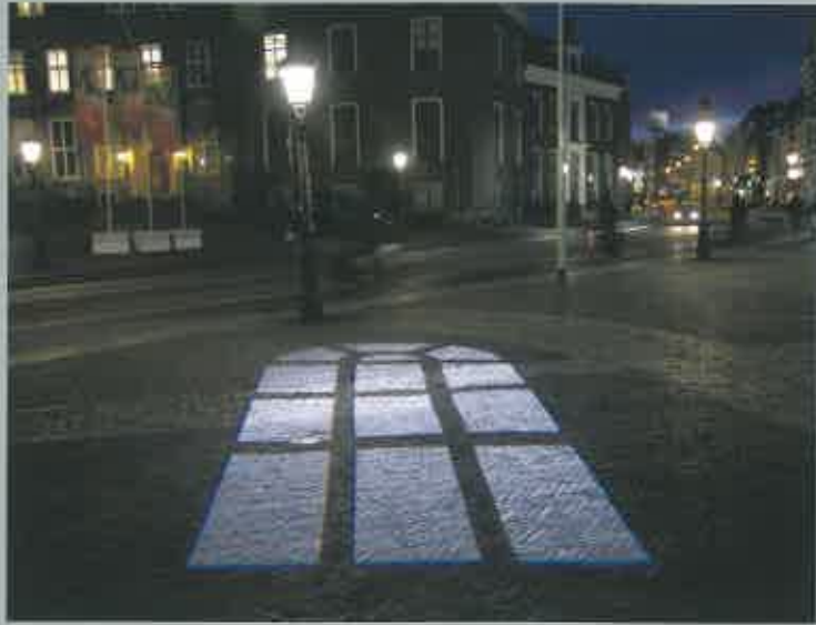
'Trajectum Lumen' ook in en om de Janskerk